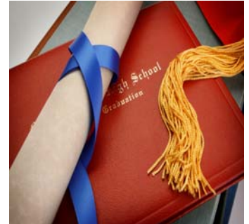
Su hijo(a) puede permanecer en el Programa de Becas McKay hasta que se gradúe de secundaria.

La ley federal requiere que el distrito escolar ofrezca re-evaluación a todos los estudiantes que son parte de Educación Excepcionales para Estudiantes (ESE) por lo menos cada tres años. Esto también aplica a los estudiantes en escuelas privadas, incluyendo estudiantes con Becas McKay. El padre tiene la opción de aceptar o rechazar que le hagan una re-evaluación a su hijo(a). La re-evaluación puede consistir de pruebas y observaciones reportadas por los padres y maestros del niño(a), parecida a la evaluación hecha cuando el estudiante se considero para el ESE. La re-evaluación no producirá un nuevo IEP, no cambiara el nivel de código de matriz y no afectara el estatus de la Beca McKay del niño(a). Adicionalmente, la re-evaluación no requiere volver a matricularse en una escuela publica y no resultara en que el distrito escolar le de otros servicios al estudiante de McKay. Si usted decide aceptar la re-evaluación, los resultados pueden darle una ilustración actualizada del progreso de su hijo(a) y necesidades de aprendizaje a usted y a la escuela privada. Si tiene preguntas sobre el proceso de re-evaluación, por favor ponerse en contacto con la oficina de ESE de su distrito escolar.