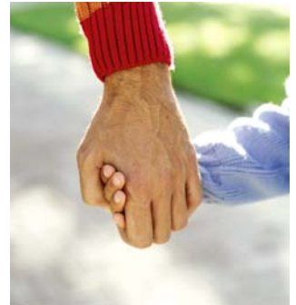
Usted es responsable de la educación de sus hijos.

“Asegúrese que la escuela que ha escogido provee el plan de estudio, servicios, y enfoque educacional que su hijo(a) necesita.”