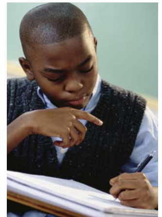
Un niño(a) que haya perdido su beca puede volver a clasificar después de un año en una escuela publica de la Florida

Una nueva solicitud se debe someter, y se deben de llenar todos los requisitos.