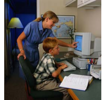
Designe una área de estudio en el hogar, lejos de distracciones, con lápices, papel y otros materiales.

Siendo un padre involucrado, usted y su escuela pueden ayudar a su hijo(a) alcanzar el éxito.