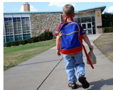
Un estudiante McKay trasladándose de regreso a una escuela publica puede volver entrar en la escuela de su zona o escoger una escuela publica diferente bajo la opción de escuelas publicas de McKay.

“La primera escuela a la cual el estudiante asista por los primeros 10 días del periodo de pago recibirá el pago trimestral.”